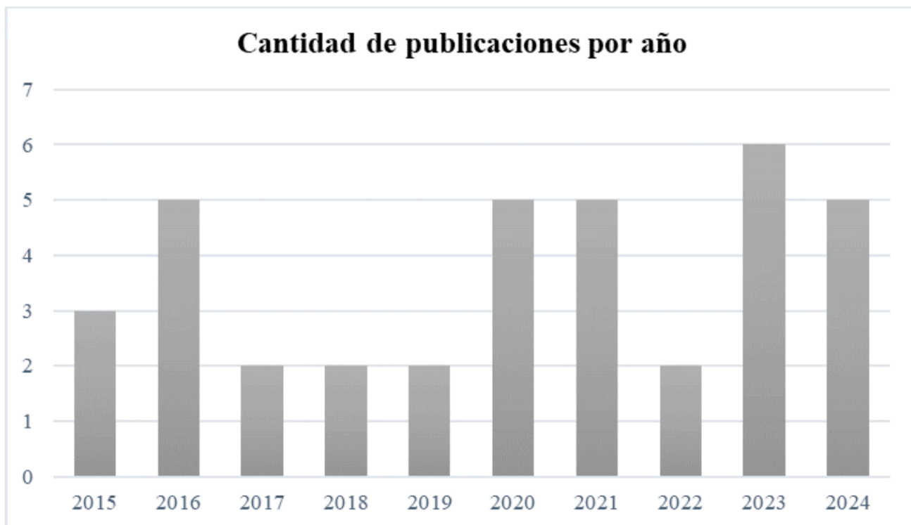
Figura 2 Cantidad de estudios por año de publicación.

En la Tabla 3 se presentan las investigaciones realizadas por país, donde se puede observar que la mayoría proviene de Brasil (n=22). Esto coincide con las observaciones de Caldas y Crispino (2017), en cuanto al impacto positivo que han tenido las políticas educativas de divulgación y de alfabetización científica en este país, especialmente en el ámbito de la física, posicionándolo como referente en este campo de investigación para América Latina.