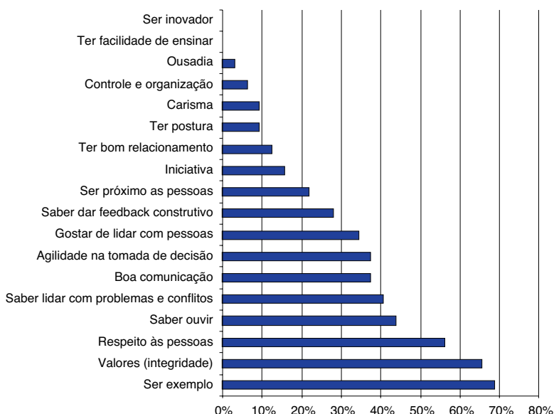
Figura 3. Escolhas dos respondentes em relação às características do líder