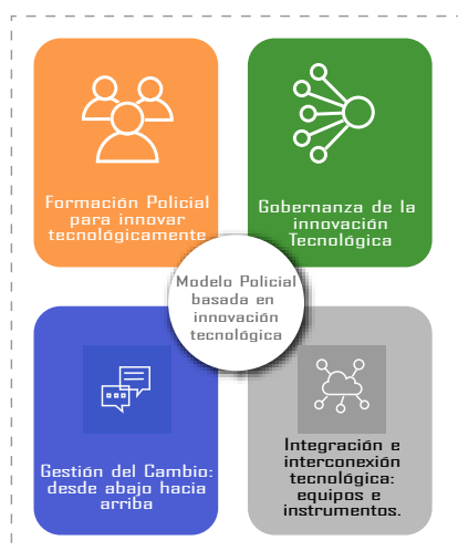
Figura 4. Propuesta del Plan de Acción para incluir la innovación tecnológica en materia policial de Fuerza Pública.

Igualmente, a raíz de la investigación realizada, se recomienda al cuerpo policial civil costarricense elaborar e implementar un plan de acción para incluir la innovación tecnológica en materia policial. Para este plan, se han identificado cuatro grandes componentes: la formación policial, la gobernanza, la gestión del cambio institucional y la integración e interconexión tecnológica que abarca desde herramientas hasta equipos tecnológicos (figura 4).