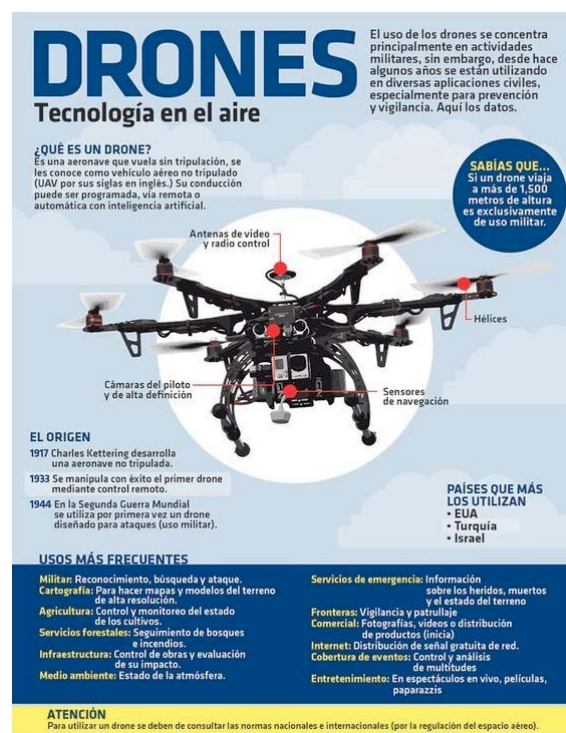
Figura 1. Drones: Tecnología en el aire.

En esta misma temática, el uso de drones es otra de las herramientas de la IA que, en el último año, está siendo aplicada con mayor frecuencia por los cuerpos policiales para la seguridad ciudadana (figura 1). Algunas de las ciudades que están implementando los drones para la vigilancia policial son México (Miguel, 2018), Barcelona (Llorca, 2018), Bogotá (Trujillo, 2019) y Nueva York (Simon, 2018).