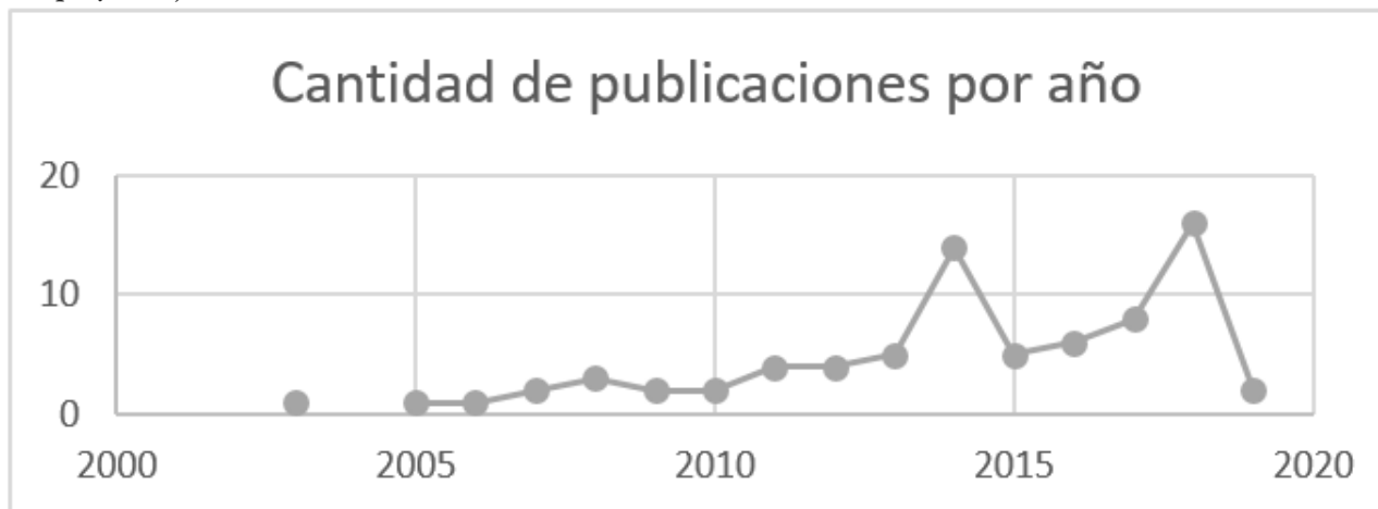
Figura 1. Cantidad de publicaciones por año sobre gestión del conocimiento y sostenibilidad

El horizonte temporal se eligió de 1980 a 2019, aunque, sólo se consideraron dos meses del 2019 por encontrarse dentro del periodo de realización de este estudio y así evitar excluir las investigaciones más recientes. Se partió de 1980 debido a que las investigaciones en el área de gestión de operaciones propiciaron la adopción del término de Gestión de Cadena de suministro en esa década. Como puede observarse en la figura 1 el primer estudio se publicó en 2003, éstas se han ido incrementando con el tiempo y reflejándose en 2018 la cantidad más alta.