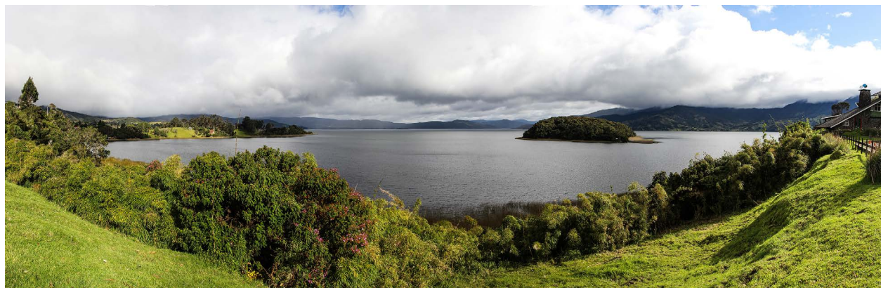
Figura 3. Panorama de la laguna de La Cocha