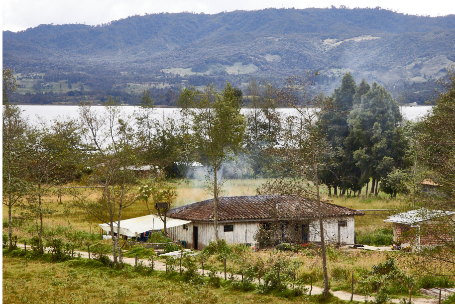
Figura 2. Vereda Casapamba