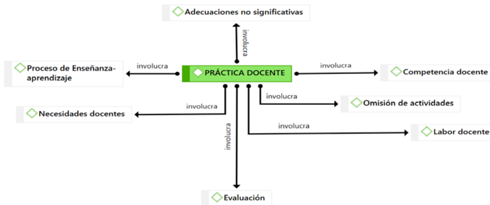
Figura 1. Red semántica sobre la práctica docente desde la perspectiva del profesor.

La siguiente figura permite visualizar las conexiones entre los códigos o conceptos identificados en esta categoría: adecuaciones no significativas, proceso de enseñanza-aprendizaje, competencia docente, omisión de actividades, labor docente, evaluación, necesidades docentes y nuevamente proceso de enseñanza-aprendizaje.