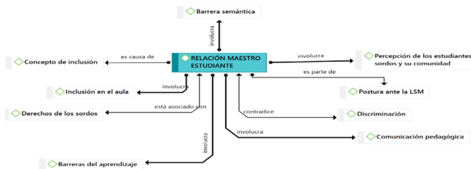
Figura 2. Red semántica sobre la relación maestro-estudiante.

Además, una capacitación insuficiente en temas relacionados con la inclusión contribuye a una comprensión distorsionada del concepto de inclusión y de las prácticas inclusivas necesarias para garantizar una educación equitativa y efectiva (véase figura 2).