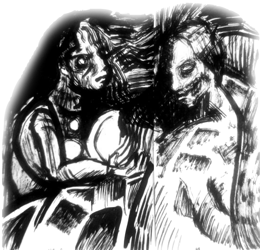
Ilustración: Alejandro Ramírez.

Los componentes formales (en la forma del contenido) en la experiencia estética de leer una historieta son los siguientes: inicio / diseño / trazo / color / narración / género / lenguaje / intertexto / ideología / final . Éstos son los componentes que es necesario estudiar para establecer aquello que se conserva, se transforma, se elimina o se añade en el proceso de la traducción de una historieta a una película. Por su parte, las formas de la narrativa