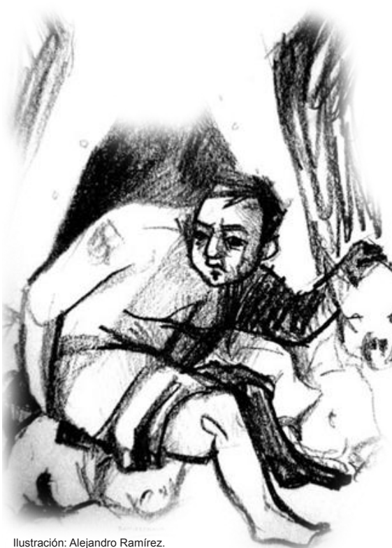
Ilustración: Alejandro Ramírez.

Más recientemente se puede hablar de un tercer modelo, claramente inscrito en el análisis del discurso. Para Peter Torop,