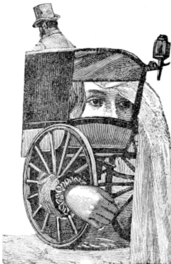
Enrique Molina (Buenos Aires 1910-1997), collage de su libro Fuego Libre , Losada, 1962.

Pero hacia las primeras décadas del siglo XX, este debate sobre la identidad nacional se había transformado notablemente no solo en