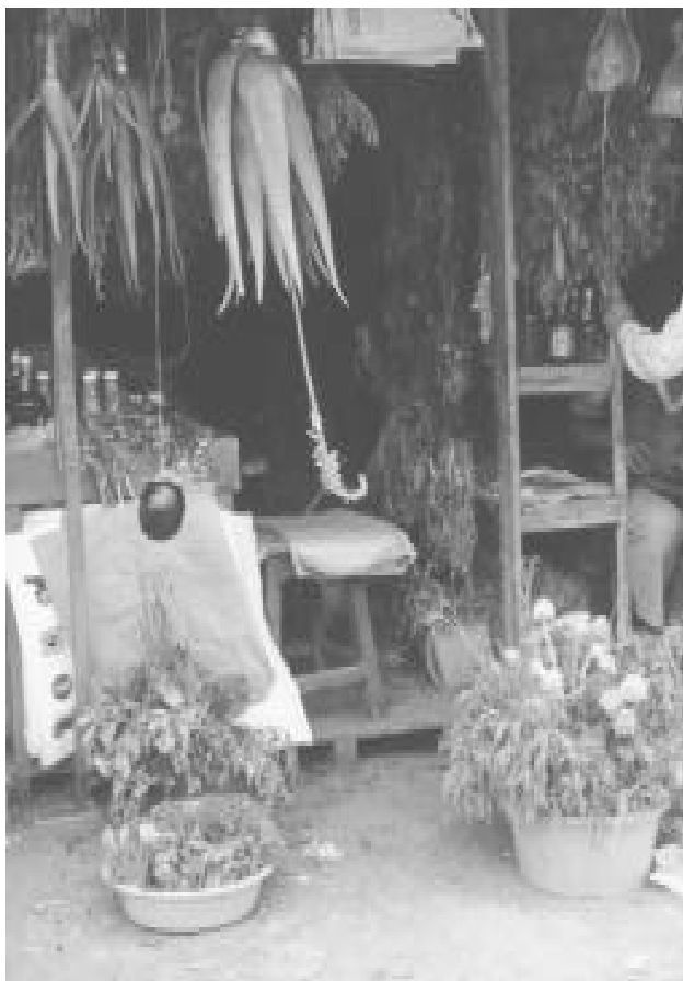
Quindío, Colombia, 1999.

del mercado, tal como quedó evidenciado en la cumbre de Florencia en la que participaron Bill Clinton, Lionel Jospin, Gerard Schroeder, Massimo d'Alema y Tony Blair los días 20 y 21 de noviembre de 1999; y, por último, el estruendoso fracaso de la “Cumbre del Milenio” de la