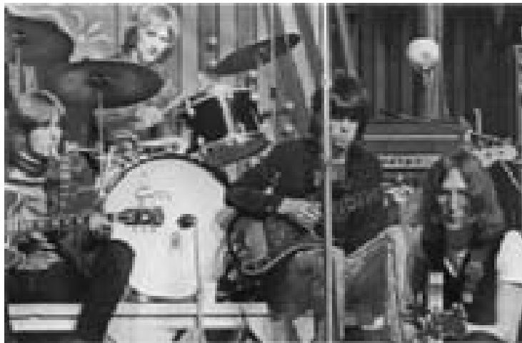
Eric Clapton, Mitch Mitchell, Keith Richards y John Lennon

mentado. El alarmismo ante los contenidos de las letras o ante los sonidos llamados estridentes o duros, procede como si las músicas estuvieran afuera de lo social. No es que las músicas sean un reflejo transparente y automático de la realidad, es más bien que las músicas se constituyen en crónicas de lo contemporáneo. Si en sus ori-