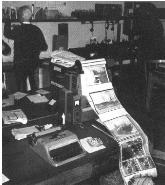
Fotos de la guerra transmitidas por telefoto.

Sin embargo, el acceso al poder y la transformación de las formas de hacer política, no están aseguradas por los entes subversivos únicamente por estar en la Red. Las transformaciones políticas contemporáneas están ligadas a la emergencia y flujo de los espacios en redes globales que