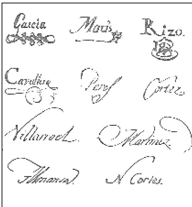
Firmas de los dibujantes de la Expedición Botánica