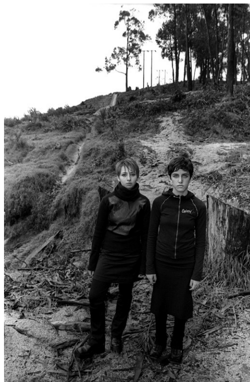
▪ Vampiros en la sabana 2 , 2003 | Fotografía blanco y negro, 120 x 80 cm

Ella sabe que, aunque navegue en el Nilo, navega en la historia; en las aguas que “fueron igualadas a las lágrimas de Isis en su duelo por la pérdida de Osiris” (Llanos, s/f: s/p). Como un río, su obra no sólo es fértil en producción, sino rica en mensajes, múltiple en