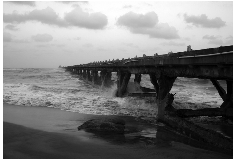
■ Más allá 1 , 2009 | Fotografía digital, 120 x 80 cm