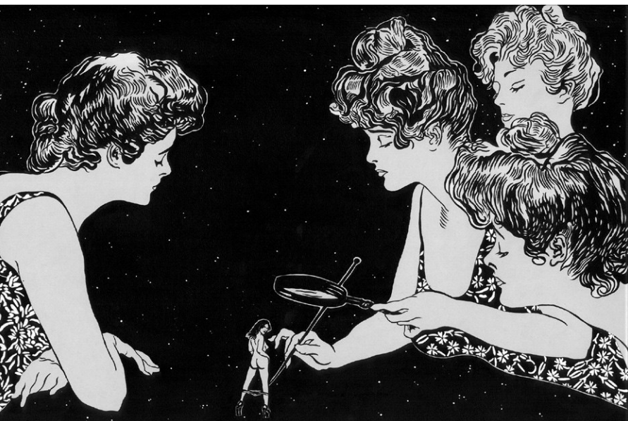
▪ Felicidad clandestina 4 , 2008 | Tinta y acrílico sobre papel, 54 x 38 cm