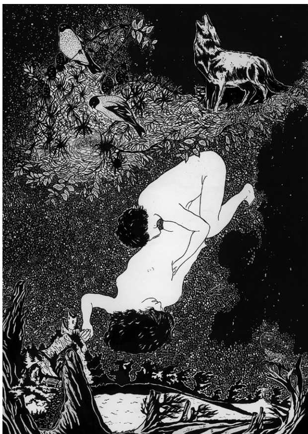
■ The end 2 , 2006 | Acrílico sobre papel, 46 x 60 cm

paredes de mi taller en la maestría que entendí el concepto no lineal del tiempo que luego utilicé en una de mis animaciones, La mano en el fuego , y en la publicación Mi destino esta en tus manos 7 .