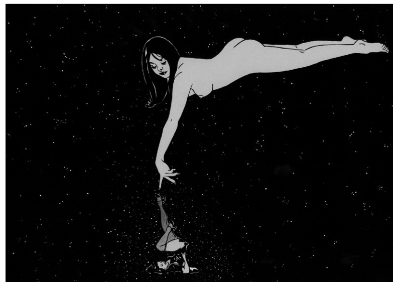
■ Felicidad clandestina 2 , 2008 | Tinta y acrílico sobre papel, 54 x 38 cm

Las bellas figuras horripilantes operan como gárgolas para que nadie entre en la zona sobre la cual no