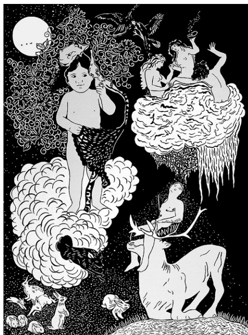
■ Videntes 1 , 2007 | Tinta y acrílico sobre papel, 40 x 50 cm