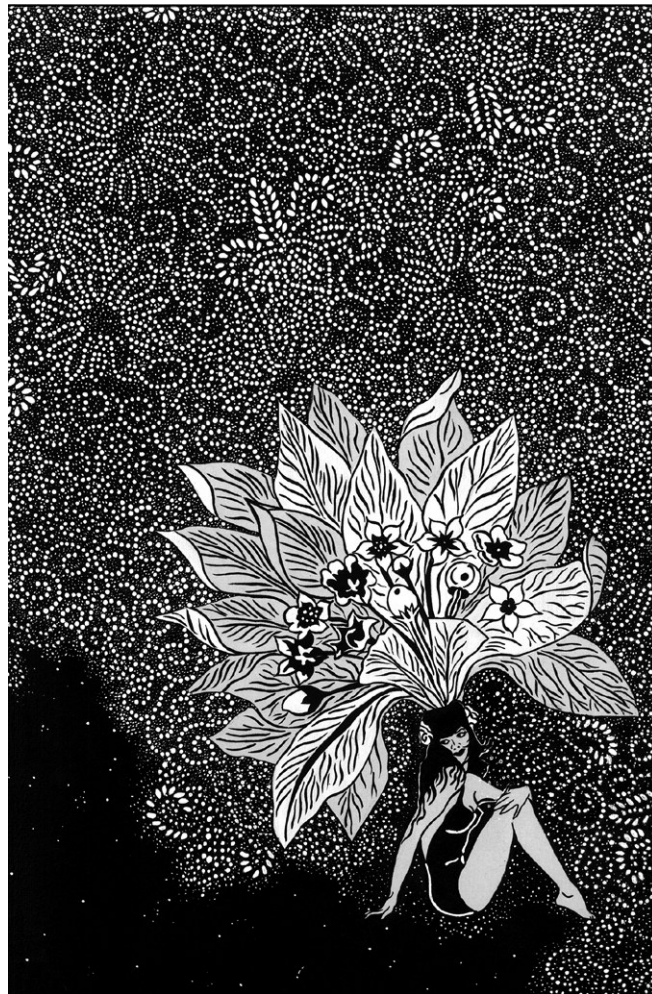
▪ Felicidad clandestina 3 , 2008 | Tinta y acrílico sobre papel, 38 x 54cm