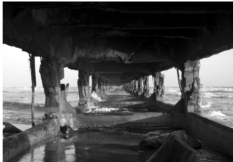
■ Más allá 2 , 2009 | Fotografía digital, 120 x 80 cm

Famosa frase inscrita en el frontón del templo de Apolo en Delfos. Aforismo atribuido a tantos sabios griegos que, finalmente, culminó declarándose que fue una sentencia que descendió “del cielo”. Nosce te ipsum es el libro de los eternos finales. Cada vez que se consulte, a modo de oráculo, un libro termina, incitando así al consultante a reconstruir el inicio, o a resignarse a vivir siempre en el final,