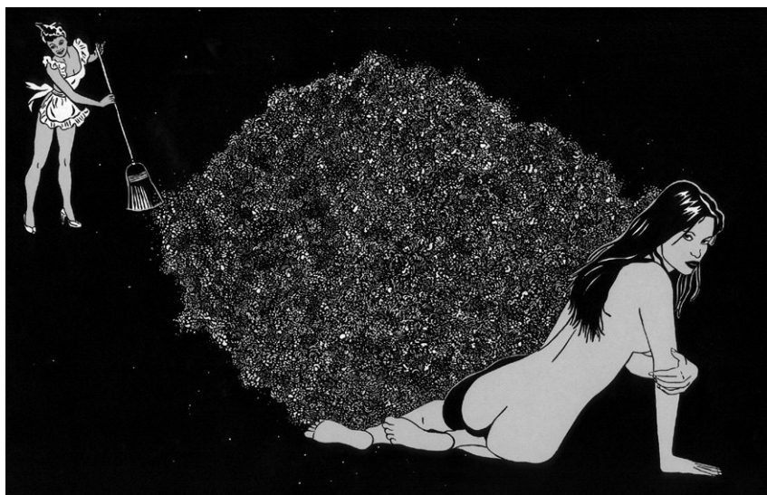
▪ Felicidad clandestina 6 , 2008 | Tinta y acrílico sobre papel, 54 x 38 cm

quedando como única opción sensata despertar al eterno presente. Para aquellos que se amparan en la fiel compañía de un libro para entender y reescribir la historia de su vida, este ejemplar, cual pitonisa, se convertirá en un libro de cabecera que puede iniciarse/terminarse infinitamente e invocar de esta manera el poder del ahora. (Rueda, 2015: s/p)