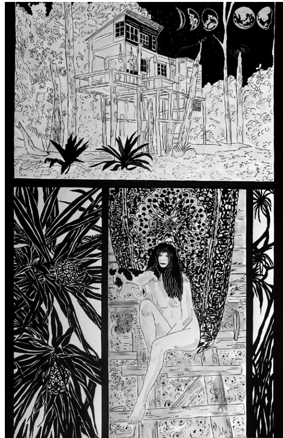
■ Superficie sensible 1 , 2015 | Tinta sobre papel, 70 x 100 cm

Cada proyecto encuentra su medio. [...] A veces realizo un proyecto en un medio que termina comportándose como otro. [...] Así que un medio se va transformando en otro según se crea la imagen. El video de Visión Remota comenzó como fotografía y se transformó en video; la imagen no se concretó hasta que se puso en movimiento, pero tardé años en darme cuenta. Y fue a partir de un mural en las