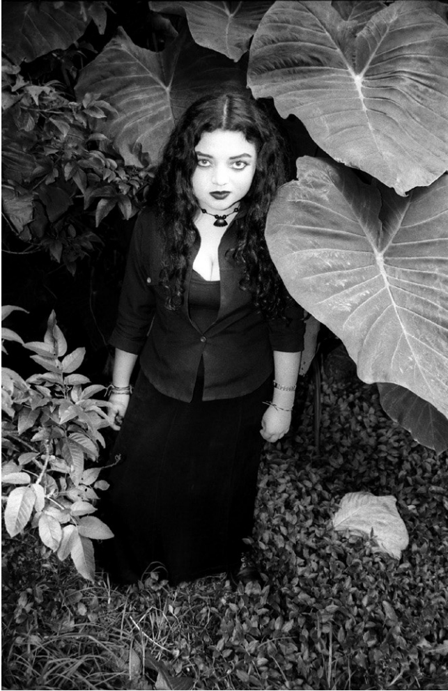
■ Vampiros en la sabana 1 , 2003 | Fotografía blanco y negro, 120 x 80 cm