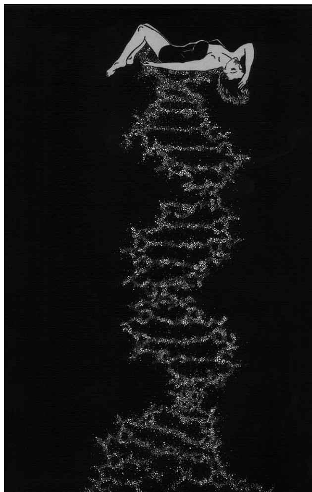
▪ Felicidad clandestina 1 , 2008 | Tinta y acrílico sobre papel, 38 x 54 cm

Entre vida y vacío. Entre flujo y frontera.