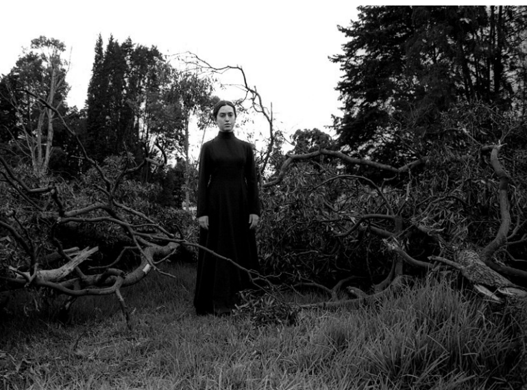
▪ Vampiros en la sabana 3 , 2003 | Fotografía blanco y negro, 120 x 80 cm

De esas estrellas, de esos vampiros cundiboyacenses, de esas guerreras marginales, surgen miradas cómplices para las cuales la muerte es irrelevante; seres con cuerpos etéreos (seguramente por la ausencia de tanto yo), seres tan diferentes que parecen iguales, donde el contacto con el negro del inconsciente aparece como trasgresor del orden de esta sociedad del autoconocimiento, que a cada objeto o ser le impone su carpeta, su resguardo... para luego archivarlo, catalogarlo o disponerlo en una mesa de observación.