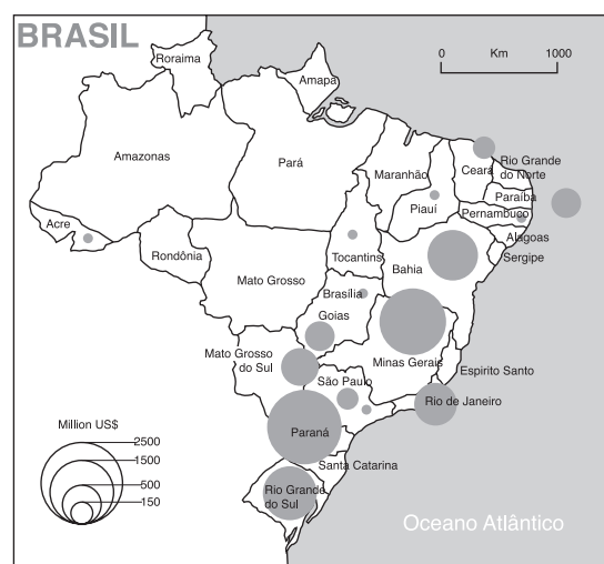
Figura 1 Distribuição Territorial dos Investimentos Credenciados no Novo Regime Automotivo (1996-2001), por Estado