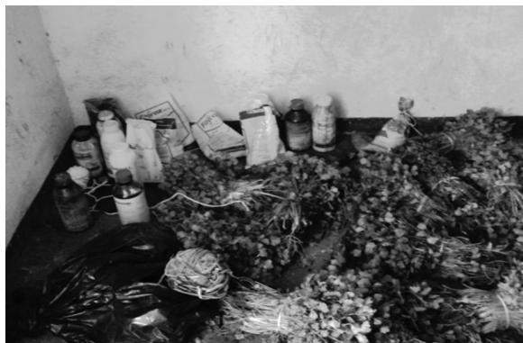
Figura 2. Almacenamiento de agroquímicos junto a cosecha de cilantro en un predio (Marinilla, 2011-2012)

los encuestados sobre los riesgos asociados a la manipulación de agroquímicos, se encontró que el 58% los conocían, principalmente la intoxicación (47%).