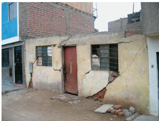
Figura 1 – Casa muy dañada en el barrio 1° de Mayo

La distribución de los daños evidencia con claridad 2 zonas particularmente afectadas. Estas corresponden a los barrios 1° de Mayo y Villa María del Perpetuo Socorro. Estos barrios situados sobre antiguas zonas de relleno sanitario, aparecen menos consolidados en relación con los barrios vecinos. Las calles no están asfaltadas y las casas son precarias, igual que el acceso a los servicios públicos, tal como es el caso de la red de agua potable y de desagüe. Se observan también