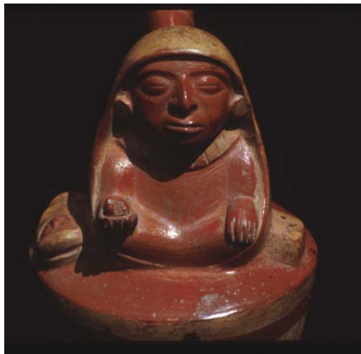
Fig. 5 – Mujer encapuchada con niño, caja y San Pedro en la mano (Foto: Douglas Sharon. Museo Larco Herrera, Lima).

Además, Bourget (2001: 102-105) sostiene que en algunos casos estas mujeres encapuchadas —especialmente las viejas arrugadas— están llevando niños para ser sacrificados a los ancestros.