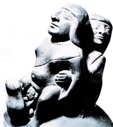
Fig. 4 - Mujer encapuchada como partera (Foto: Fernando Cabieses. Museo Larco Herrera, Lima).