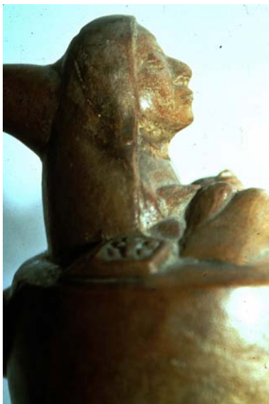
Fig. 11 - Cerámica de la cultura mochica donde una curandera utiliza piedras para curar a un paciente postrado (Foto: Bonnie Glass-Coffin, Museo Nacional de Antropología, Lima, Catálogo #C-54571).