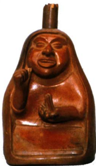
Fig. 12 - Cerámica de la cultura Lambayeque donde una curandera alza un pedazo de San Pedro en la mano (Foto: Bonnie Glass-Coffin, Museo Larco Herrera, Lima).