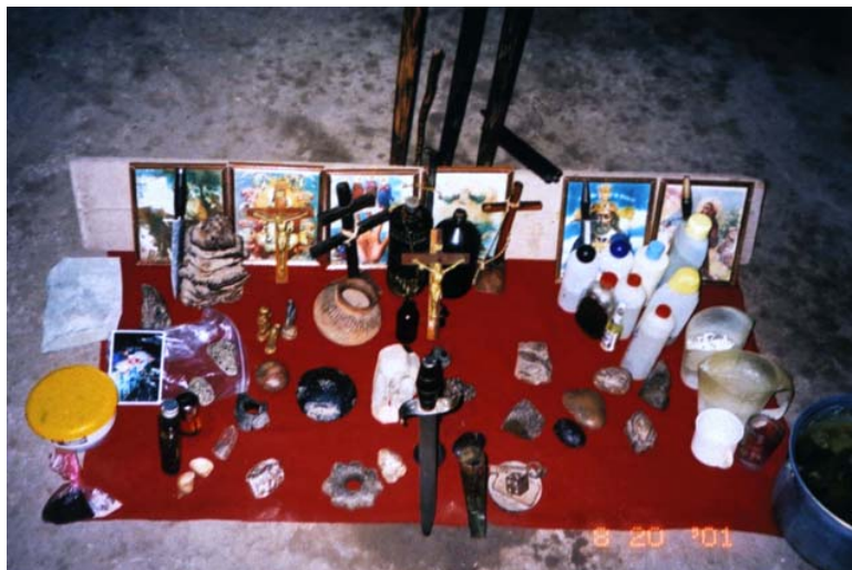
Fig. 10 – Mesa de Ysabel donde se ve el disco entre otros artes.