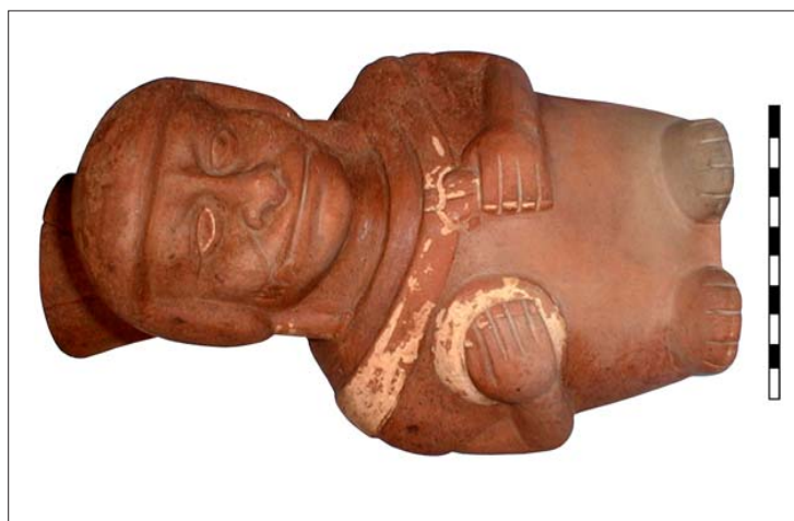
Fig. 2 - Tumba 10, mujer con disco.