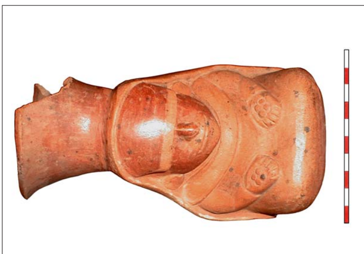
Fig. 1 - Tumba 7, mujer con túnica.