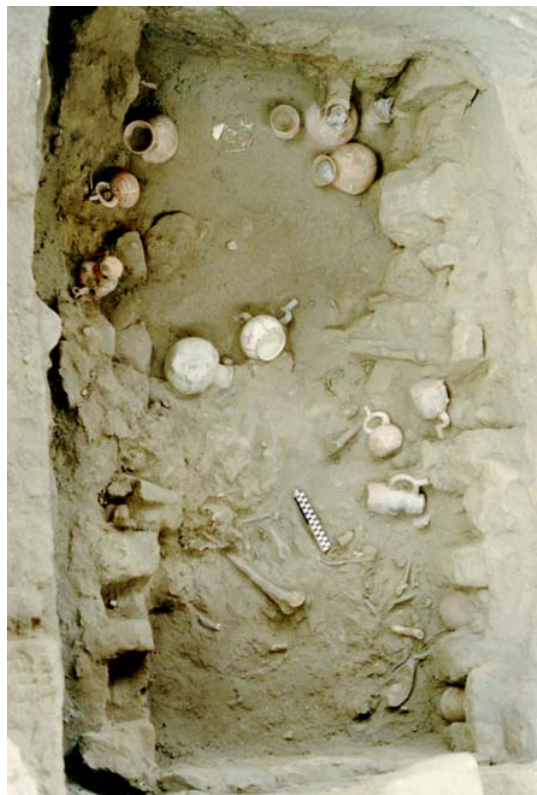
Fig. 3 - Tumba de cámara, ceramios de nichos en filas paralelas (este y oeste).