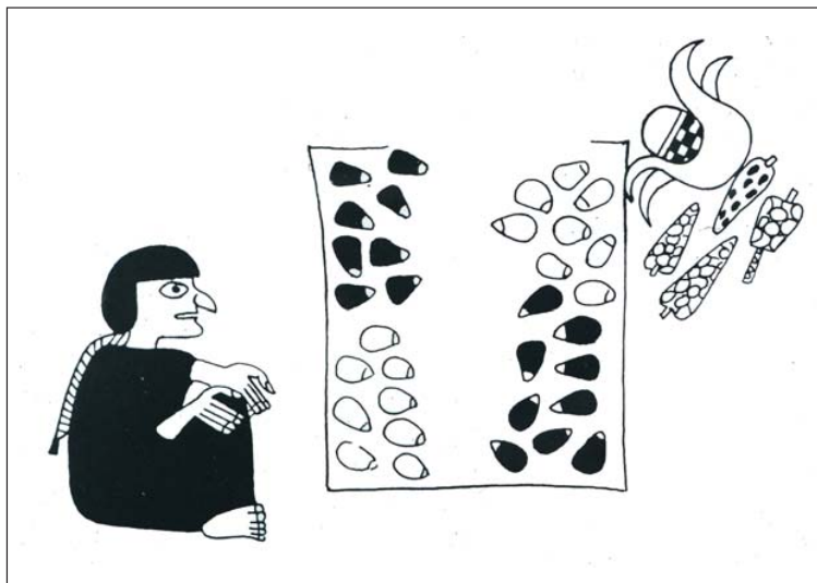
Fig. 8 - Mujer con cabello descubierto ordenando granos de maiz en una manta (Alva, 2000: dibujo 1).

poder a la “mesa” y al oficiante. Se conocen hallazgos de “mesas” asociadas a probables tumbas de curanderos prehispánicos altamente apreciada por los actuales. La disposición, la parafernalia ritual está regida por los conceptos de la cosmovisión Mochica (y andina), basada en el dualismo, referente a las dos fuerzas opuestas pero complementarias que rigen el universo, reflejadas en las oposiciones sol-luna, día-noche, negativo-positivo, macho-hembra, etc... ” (Alva, 2000).