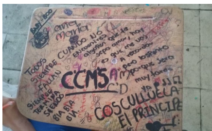
Imagen 6. Aula de clase: silla - grado 7°B.

Eres el Hard de mi Core, hace alusión a una comunidad de música metálica, raperos