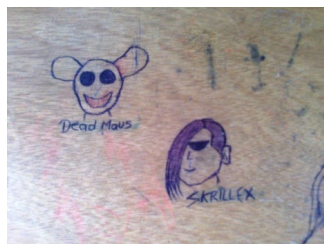
Imagen 6. Aula de clase: silla - grado 6°B.