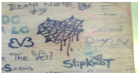
Imagen 17. Aula de clase: silla - grado 7°A.

con identidad y capacidad de afrontar cada problema presentado, les marcan su vida. El agobio y el sufrimiento por no encontrar en quienes confiar una solución a sus conflictos, les lleva a describir tal inconveniente en su espacio escolar a través de las imágenes que representa su tristeza o inconformismo: “es lo que quiere decir, el corazón le está chorreando sangre, como que está tan herido que está todo raro...”