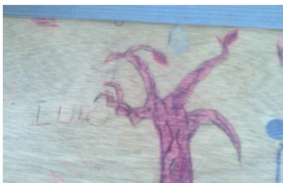
Imagen 15. Aula de clase: silla - grado 7°A.

No todas las manifestaciones de los estudiantes transmiten mensajes de poder, de resistencia, droga, fanatismo, entre otros... Podemos encontrar además que algunos de ellos se divierten en su espacio escolar armonizando y recreando cada parte del espacio institucional como se puede observar en la imagen "Supongo que lo hizo por hacerlo, por pasar el tiempo" . Las manifestaciones simplemente se dan sin sentido: "No le veo ningún sentido, en forma de nada, es como un árbol seco, es un dibujo abstracto" . Es entonces donde nos preguntamos: ¿son prácticas de ausentismo o discordia?, ¿son llamados a la reflexión? o por el contrario "Es una mata de culo, ahí dice culo. No... es de lulo (Risas)" .