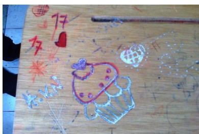
Imagen 10. Aula de clase: silla - grado 6°A.

Ahii un pastel, tenía hambre, ahh... que le gusta el pastel, ohh un coctel. Es un ponqué, una torta pequeñita.