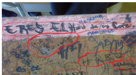
Imagen 5. Aula de clase: silla - grado 6°A.