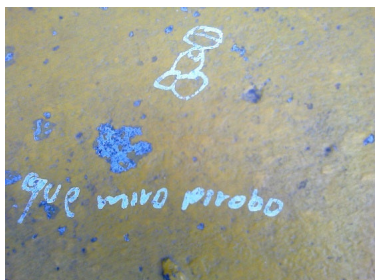
Imagen 9. Aula de clase: silla - grado 6°B.