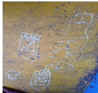
Imagen 8. Aula de clase: silla - grado 6°B.

El FCB, PUEDE SER futbol Club Barcelona,