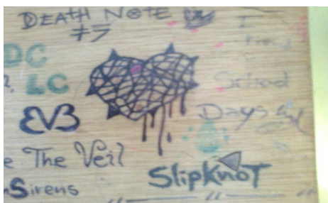
Imagen 1. Aula de clase: silla - grado 7°A.

En este sentido, muchas de las representaciones iconográficas que los estudiantes realizan se relacionan con estos temas, tanto así que algunos de ellos aseveran que “ Los compañeros dejan su nombre como si fueran propios... de ellos... ”; práctica desde la cual definen sus territorios, dejan su huella o su marca en los objetos.