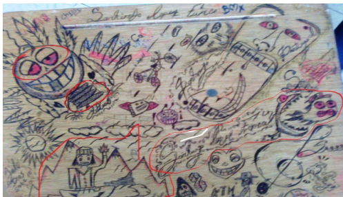
Imagen 2. Aula de clase: silla - grado 7°B.

Quería representar los antepasados, también fumaban marihuana, en la mano tiene la forma de esa mata y al parecer es un antepasado.