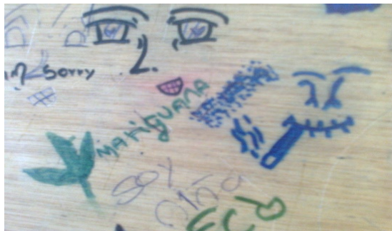
Imagen 7. Aula de clase: silla - grado 6°A.