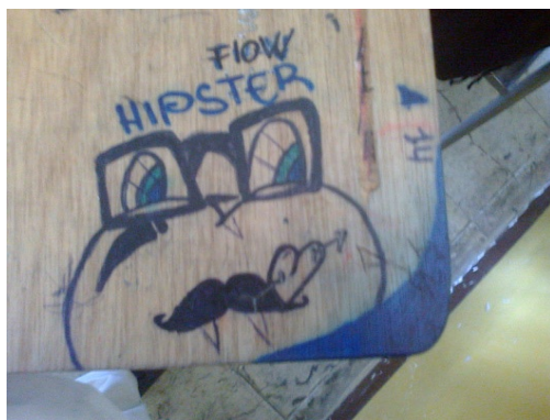
Imagen 4. Aula de clase: silla - grado 6° A.

Por otro lado, otra cultura que poco a poco va ganando adeptos son los hipster que se definen por su particular forma de vestir, e igualmente esto es expresado por los chicos en sus representaciones y reconocidas como tales por sus compañeros.