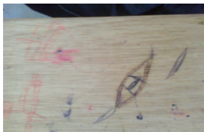
Imagen 16 Aula de clase: silla - grado 7°b.