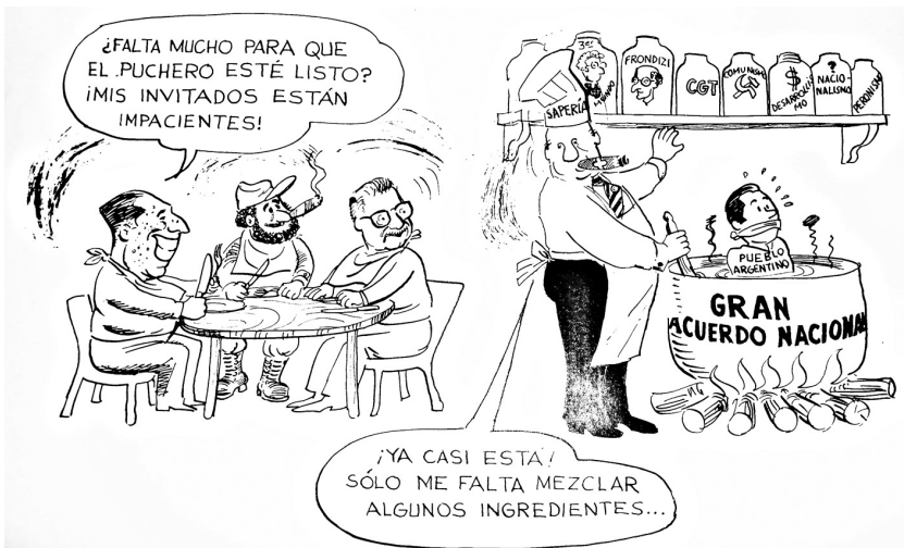
Figura 5. A “incógnita” do Grande Acordo Nacional Legenda dos ingredientes: 3º Mundo, Frondizi, CGT, Comunismo, Desenvolvimentismo, Nacionalismo, Peronismo. (Manifesto “Ver, Juzgar y Actuar”, 1ª parte: Panorama de la situación actual. Acervo da autora.)

Em tal cenário, por si desalentador, como decorre da leitura atenta do VJA, outros elementos tornariam ainda mais complexa a realidade argentina de 1971. O governo atual, segue o manifesto, é indefinido e suas características doutrinárias não seriam em nada tranquilizadoras, situação corroborada pela política de queda de barreiras ideológicas e pelo benefício que o GAN lega ao peronismo e à esquerdização do país (Fig. 5), pela correspondência entre alguns dos pontos do “programa socialista” da Confederação Geral do Trabalho (CGT), pelo terrorismo urbano que manteve atuação constante nos últimos anos, pela falta de doutrinas claras e de lideranças dos anêmicos e frágeis partidos