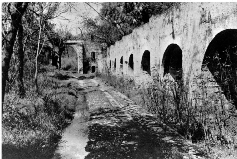
Foto 2. Ruinas del acueducto de La Escoba.