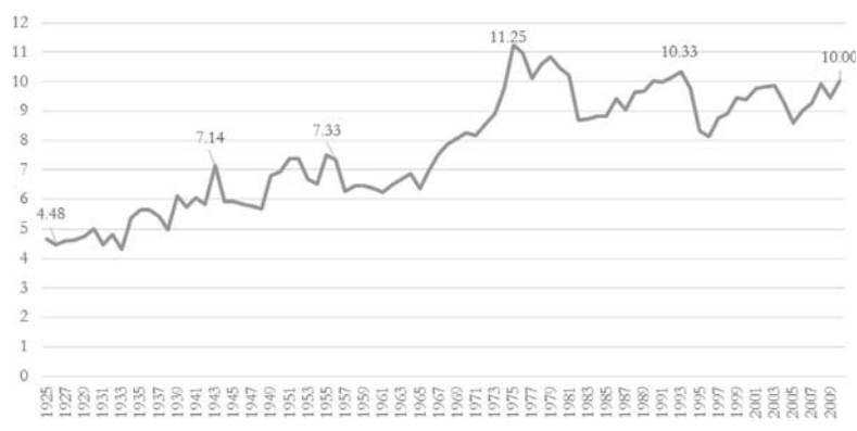
Gráfica 1. Recaudación tributaria en México 1925-2010 (% del PIB)