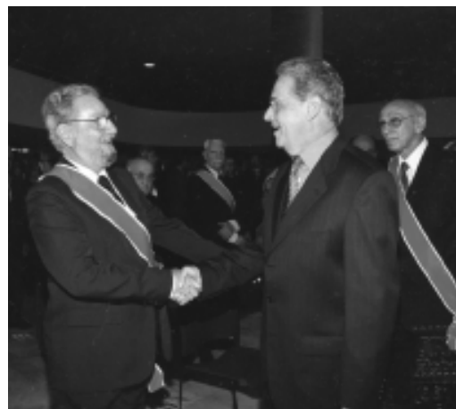
Con el presidente de Brasil, a finales de la década de 1990.