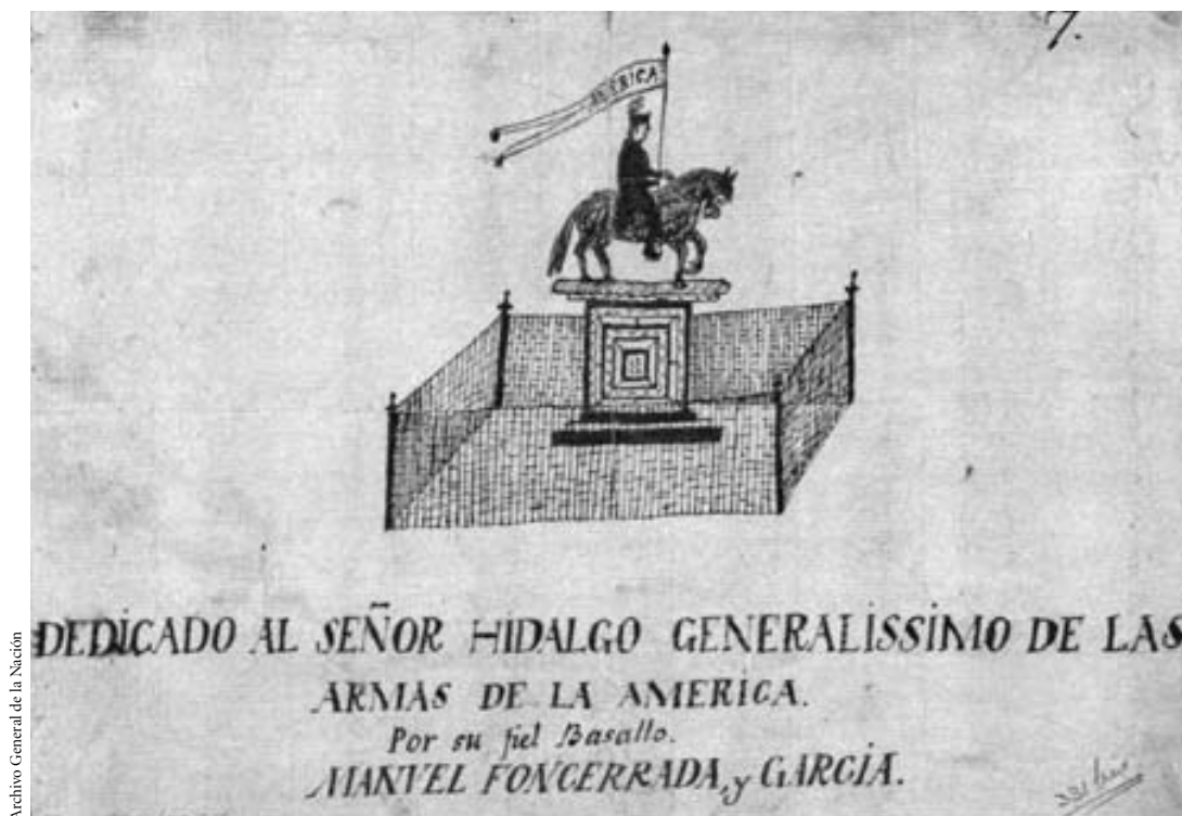
Ilustración [1810-1811].