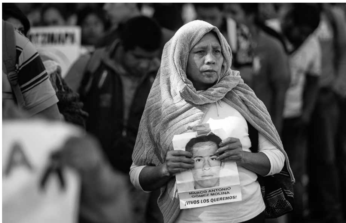
Padres de los estudiantes normalistas de Ayotzinapa desaparecidos en Iguala, Guerrero, marchan durante la protesta conmemorativa del 2 de octubre de 1968. Ciudad de México, 2015.

Un aspecto central del análisis es que se aleja de posiciones esencialistas acerca de la construcción de las identidades étnicas, puesto que el estudio pone el acento en los procesos mediante los cuales las identidades colectivas se erigen también a partir de “la utilización de atributos que ‘otros’ les han impuesto a las poblaciones indígenas (por ejemplo, el ser ecologistas, poseedores de conocimientos profundos, que son producto de una visión romántica). Esto implica un manejo selectivo de rasgos y