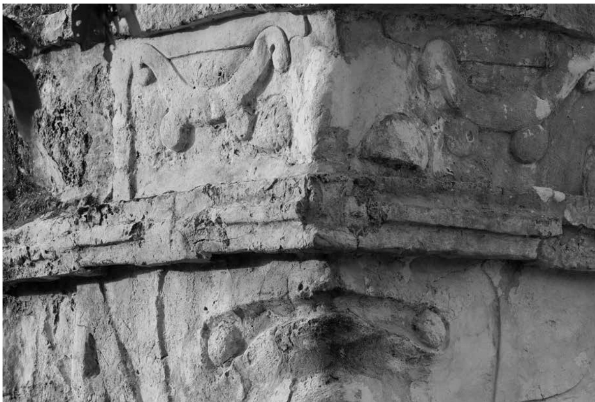
Zona arqueológica de Tulum, Cancún, Quintana Roo, México, 2012.

Claude Fell, Vasconcelos afirma contundente que se inspiró en lo que hacía Lunatcharsky en Rusia: “a él debe mi plan más que a ningún otro extraño” (1938: 25). Sin embargo, en cuanto a su proyecto de educación indígena también es determinante: “la inspiración para la enseñanza de los indios nos vino, como es natural, de la tradición española” (1938: 167). Por eso consideraba a los maestros misioneros de la educación, como lo habían sido los frailes durante la colonización hispana.