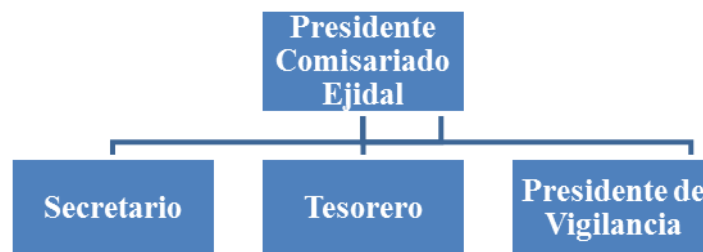
Figura 1.-Organigrama del Ejido Raymundo Enríquez

La estructura organizacional del ejido se observa en la Figura 1.