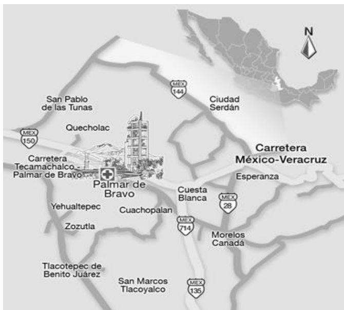
Figura 1. Localización de la comunidad de estudio (Cuesta Blanca, Puebla).

El muestreo se realizó en cinco rebaños caprinos de Cuesta Blanca (Figura 1), limitados a un radio de 500 metros (norte, sur, oeste y este) del rebaño (medular) localizado en el centro de la comunidad, con la finalidad de distribuir y concentrar el material y personal de muestreo, para favorecer el control de las muestras para su transportación al laboratorio de la Secretaria de Agricultura, Ganadería, Desarrollo Rural, Pesca y Alimentación (SAGARPA) en el estado, participando 1 alumno de la FMVZ-BUAP, 1 coordinador del proyecto y 3 profesores investigadores.