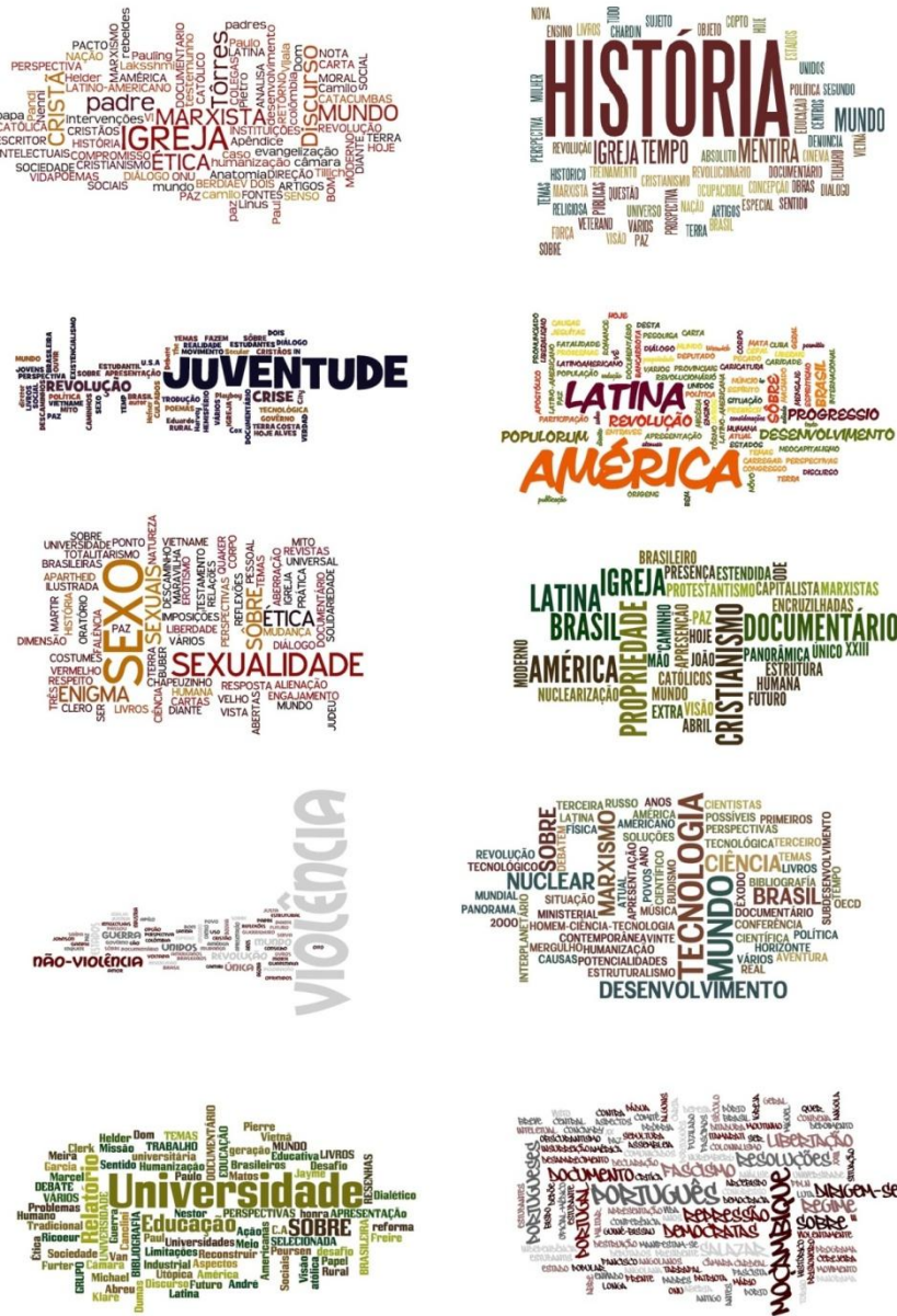
Gráfico 1: Nubes de palabras de los 10 números de Paz e Terra (1966-1969).

Referencia: Los números están dispuestos del uno al 10 de de izquierda a derecha y de arriba hacia abajo.