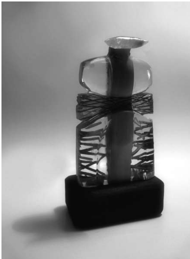
"Samurai", escultura en resina, madera y fluorita. Gustavo Gaggero

Fecha de Aceptación: 27 de diciembre de 2013