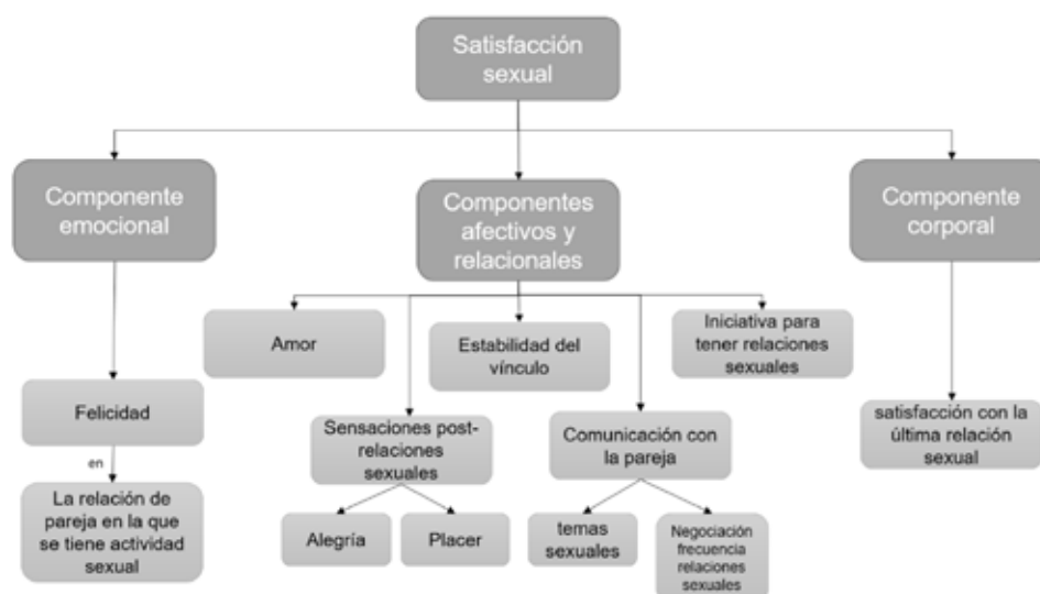
Figura 2. Satisfacción sexual 7-17 .

No existen estudios sobre satisfacción sexual en Colombia, ni tampoco sobre la implicación de los esquemas mal adaptativos tempranos en las relaciones interpersonales y de pareja. Por esta razón se realizó este estudio para establecer si hay asociación entre esquemas mal adaptativos tempranos del área de la autovaloración y el índice de satisfacción sexual en adultos jóvenes con preferencia heterosexual, del área metropolitana de Medellín, Antioquia, además de identificar la presencia de esquemas mal adaptativos tempranos del área de la autovaloración. Se determinó el índice de satisfacción sexual para establecer la posible asociación entre la presencia de esquemas mal adaptativos tempranos del área de la autovaloración y el índice de satisfacción sexual. Este estudio tuvo como propósito producir conocimiento alrededor de un tema poco estudiado en nuestro contexto y arrojó información válida y confiable que favorecerá la