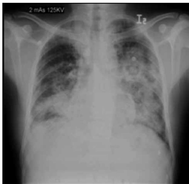
Figura 1 d. Radiografía de tórax con infiltrados de ocupación alveolar en cuatro cuadrantes.