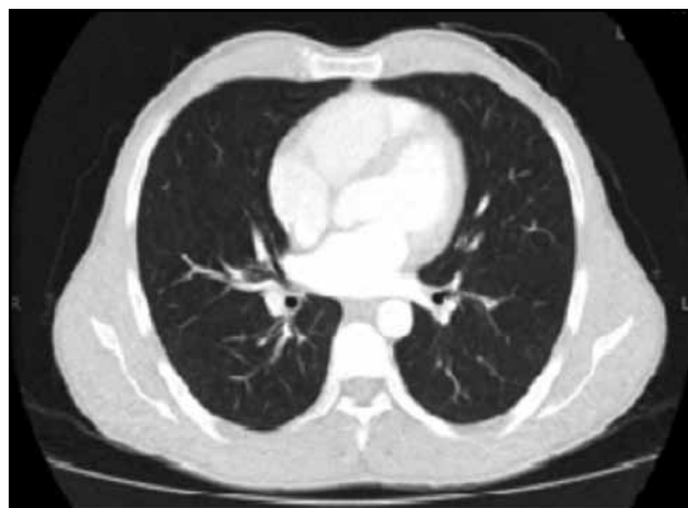
Figura 1c. TAC de tórax con contraste normal.