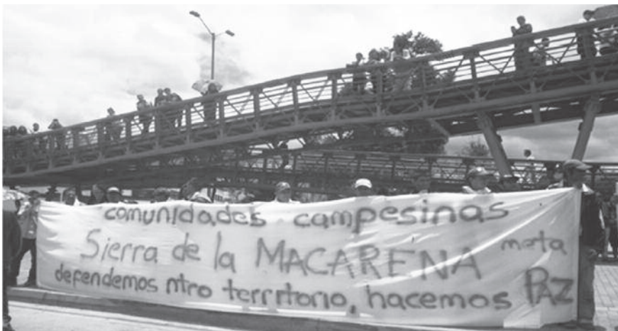
Foto 1. Marcha por la paz en Bogotá, 9 de abril de 2015.