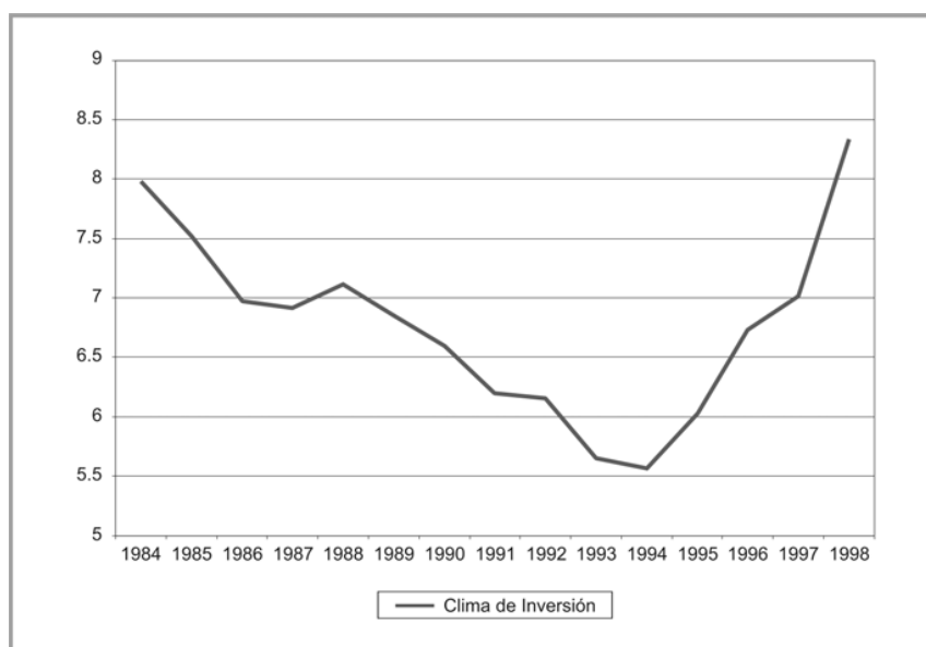
Gráfica 2. Promedio mundial del índice de clima de inversión del Grupo PRS 13 .

para dos períodos cortos, mientras que las variables de riesgo país lo están para todos los años y para todos los países de la muestra.