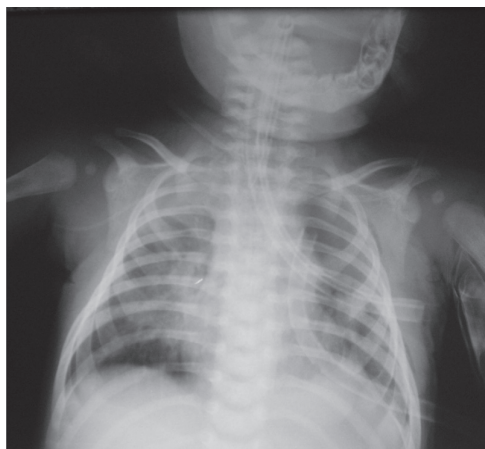
Fig. 3 – Rx pós-operatório: Reexpansão pulmonar bilateral e centralização do mediastino