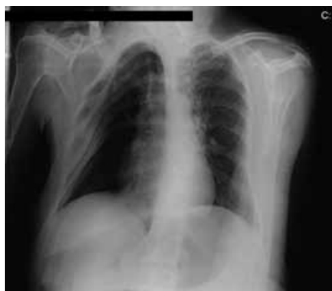
Fig. 1 – Radiografia do tórax mostrando alterações anatómicas grosseiras, decorrentes de posturas viciosas, sendo evidente a hipertransparência relativa do hemitórax direito, rotação esquerda e dificuldade em avaliar o trajecto e a permeabilidade das vias aéreas centrais

Paulo Gouveia, Arnaldo Pires, Frederica Coimbra, Isabel Trindade, Carlos Capela, Guilherme Gomes, Abel Rua