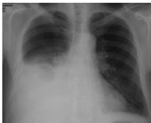
Fig. 1 – Hipotransparência homogênea na metade inferior do hemitórax direito