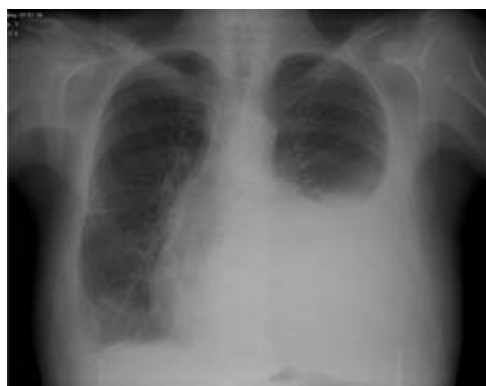
Fig. 6 – Hipotransparência homogênea de concavidade superior na metade inferior do hemitórax esquerdo