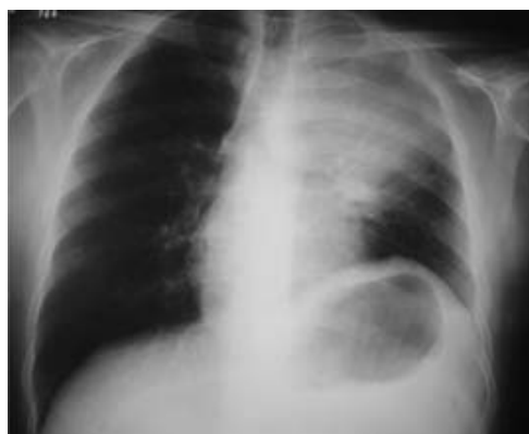
Fig. 2 – Radiograma de tórax evidenciando massa pulmonar e atelectasia no pulmão esquerdo