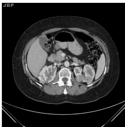
Fig. 2 – TAC (tomografia axial computadorizada) abdominal evidenciando angiomiolipomas renais bilaterais