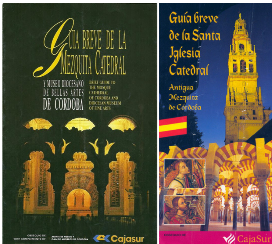
Imágenes 2 y 3. Portadas de los folletos de 1981 (izquierda) y de 1998 (derecha)