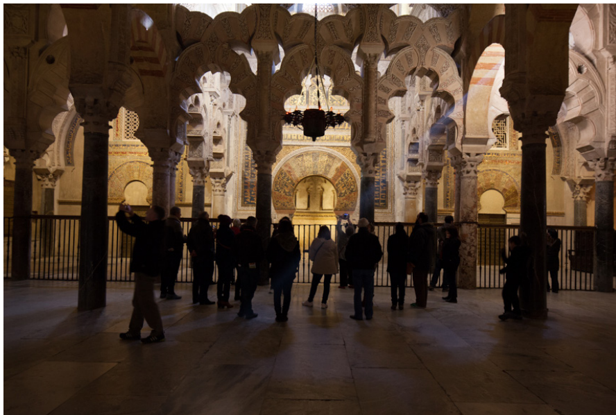
Imagen 4. Turistas en frente del mihrab de la Mezquita-Catedral