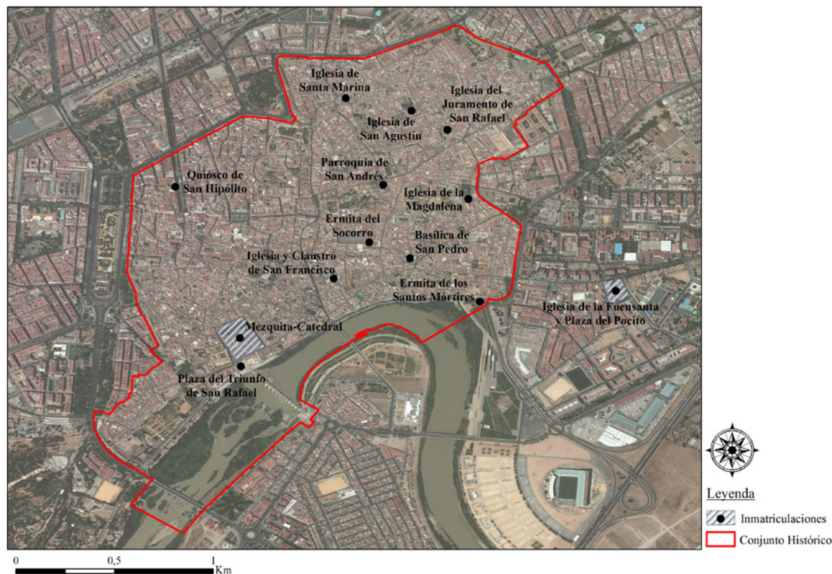
Mapa 1. Bienes de la Iglesia inmatriculados en años recientes de los que se tiene constancia (junio de 2015)