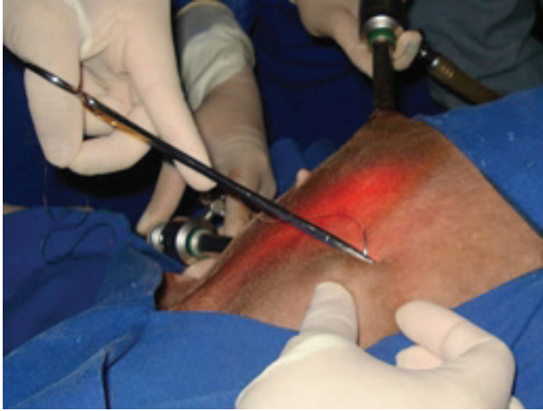
Figura 2. Fijación transparietal para la hemostasia del complejo arteriovenoso ovárico a través de electrocirugía.

Transparietal fixation for hemostasis of the ovary arteriovenous complex through electrosurgery.