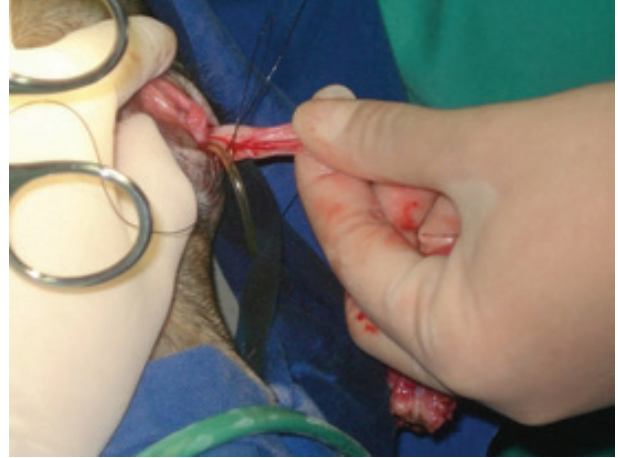
Figura 3. Exteriorización de la pieza quirúrgica después del procedimiento de H-NOTES transvaginal en una perra para OVH. Observar la sutura realizada caudalmente a la incisión de la vagina.

Grupo OOVH. La ovariectomía fue realizada usando laparotomía convencional. Las perras fueron colocadas en posición supina y exponiendo la línea media abdominal en el campo quirúrgico. Una incisión fue realizada en la línea alba inicialmente con bisturí y luego fue extendida con tijeras de Metzenbaum. El cuerno uterino izquierdo fue retirado de la cavidad con el dedo del cirujano y el pedículo ovárico fue ligado con doble ligadura