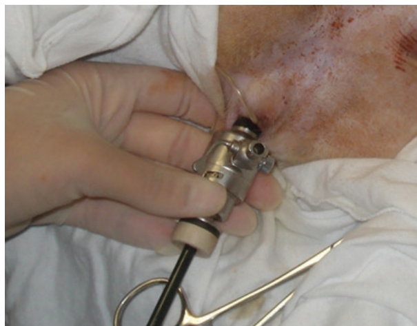
Figura 1. Abordaje transvaginal con laparoscopia control (grupo H-NOTES) en perras por ovariectomía (OVH). Se observa la posición del trocar de 6mm para la introducción de la pinza laparoscópica.

Grupo H-NOTES. En este grupo la técnica de OVH fue aplicada por NOTES transvaginal. Las perras fueron fijadas en posición de decúbito dorsal, sometidas a previa limpieza de la vagina con povidona yodada al 0,1% y sondeadas. Fue realizada una incisión de 1 cm para insertar un trocar mediante la técnica de Hasson a 1-2 cm posterior a la cicatriz umbilical en línea alba. La cavidad abdominal fue insuflada con dióxido de carbono (CO 2 ) hasta alcanzar una presión oscilante de 12 a 14 mmHg. Un laparoscopio de 10 mm y 30° fue introducido en la cánula y las estructuras abdominales fueron visualizadas. En el segundo portal (un trocar de 11 mm) fue introducido a través de la vagina con auxilio de un obturador, bajo el cérvix, con monitorización por cámara para evitar daño visceral. Todo el equipo de disección fue colocado a través del segundo portal (figura 1). Con el paciente en decúbito lateral, el ovario fue suspendido y fijado a la pared abdominal a través de un anclaje externo hecho con aguja e hilo quirúrgicos, como fue descrito previamente (Brun y col 2009). El pedículo ovárico fue cauterizado con electrocauterio bipolar (figura 2) y los hilos que sostenían el ovario a la pared abdominal fueron retirados. Luego de la cauterización y