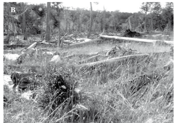
Figura 3. Rodal aprovechado en 1993-1994, con 10% de cobertura de dosel, 120.000 renovales por hectárea, agrupados, 100% ramoneados y cobertura herbácea de 100%. A) Vista general. B) Renoval ramoneado.

1993-1994 harvested stand with 10% canopy cover and 120,000 grouped seedlings per hectare, 100% browsed. A) General view. B) Browsed trees.