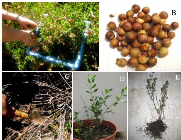
Figura 1. (A) Cuadrante para conteo de frutos; (B) semillas maduras; (C) tallos lignificados y toma muestra de suelo; (D) planta juvenil en maceta; (E) planta entera para análisis destructivo con sistema radical desarrollado.

A) Assessment of fruit yield within a square of 0.1 m 2 . B) Dry seeds after harvest. C) Soil sampling at the experimental place. D) Potted G. trinervis . E) Whole plant with a developed root system.