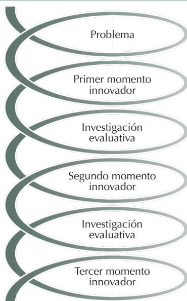
Gráfica 1. Recorrido modal de la trayectoria recursiva.

A continuación, en la gráfica 1, presentamos la trayectoria modal que denominamos recursiva. Ella implica una condensación de las recurrencias encontradas en cada uno de los recorridos de las innovaciones descritas. La trayectoria modal, sostiene