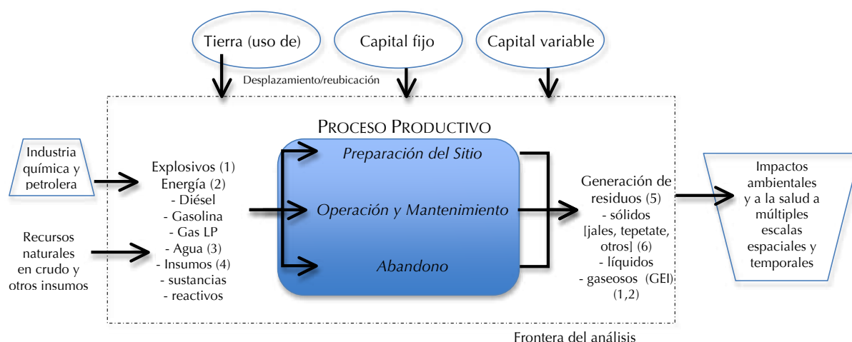
Figura 2. Esquematización de los flujos de materiales y de analizadas – proyecto minero Caballo Blanco – Fuente: Elaboración propia.

Considerando lo antes señalado, las estimaciones de GEI para el caso del proyecto minero Caballo Blanco, según ambas metodologías y etapa de desarrollo, se presentan en la Tabla 3. A lo anterior deben agregarse las emisiones de GEI y otros contaminantes por la quema de combustibles fósiles y el uso de energía eléctrica, consumos que son especificados en la MIA (MIA de Caballo Blanco 2011). Los cálculos utilizan los factores de la guía metodológica del Panel Intergubernamental de Cambio Climático (IPCC por sus siglas en inglés) IPCC 2006) y sugieren emisiones totales del proyecto por 360 mil toneladas sólo por el uso de esos insumos energéticos (mayores detalles en