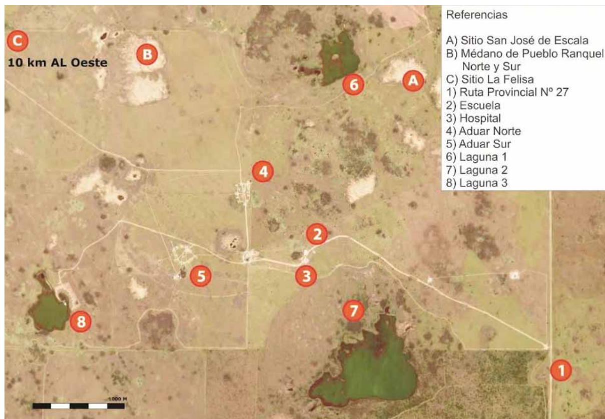
Figura 5. Vista aérea del pueblo, desde su acceso hasta el centro principal.

algunos pobladores que encuentran en dicha evidencia argumentos para validar (científicamente) sus saberes y significados –transmitidos oralmente– en torno a su vinculación con el territorio. Así, en un discurso reciente, uno de los habitantes hace referencia a su conexión ancestral con la tierra “de los carrizales”, apelando al relato de su abuelo, quien le contaba que cuando los europeos (en sus primeras excursiones) empezaron a interiorizarse acerca de cuánto tiempo hacía que estaban los rankülches en el territorio, “estos respondían –con algún lenguaraz, porque hablaban el idioma– que ancestralmente han vivido acá, no es que se hayan trasladado o que sean nómades, es decir ‘nosotros estamos acá desde tiempos inmemoriales’, decía mi abuelo; mis abuelos estaban acá y los abuelos de mis abuelos decían que ya estábamos acá”. Además, en este testimonio se hace hincapié en que “no hay un texto escrito que lo demuestre, sí tenemos las tradiciones orales, claro que sí, [...] pero creemos que el material arqueológico puede ayudarnos a certificar esto” (Poblador rankülche 9, entrevista 2014).