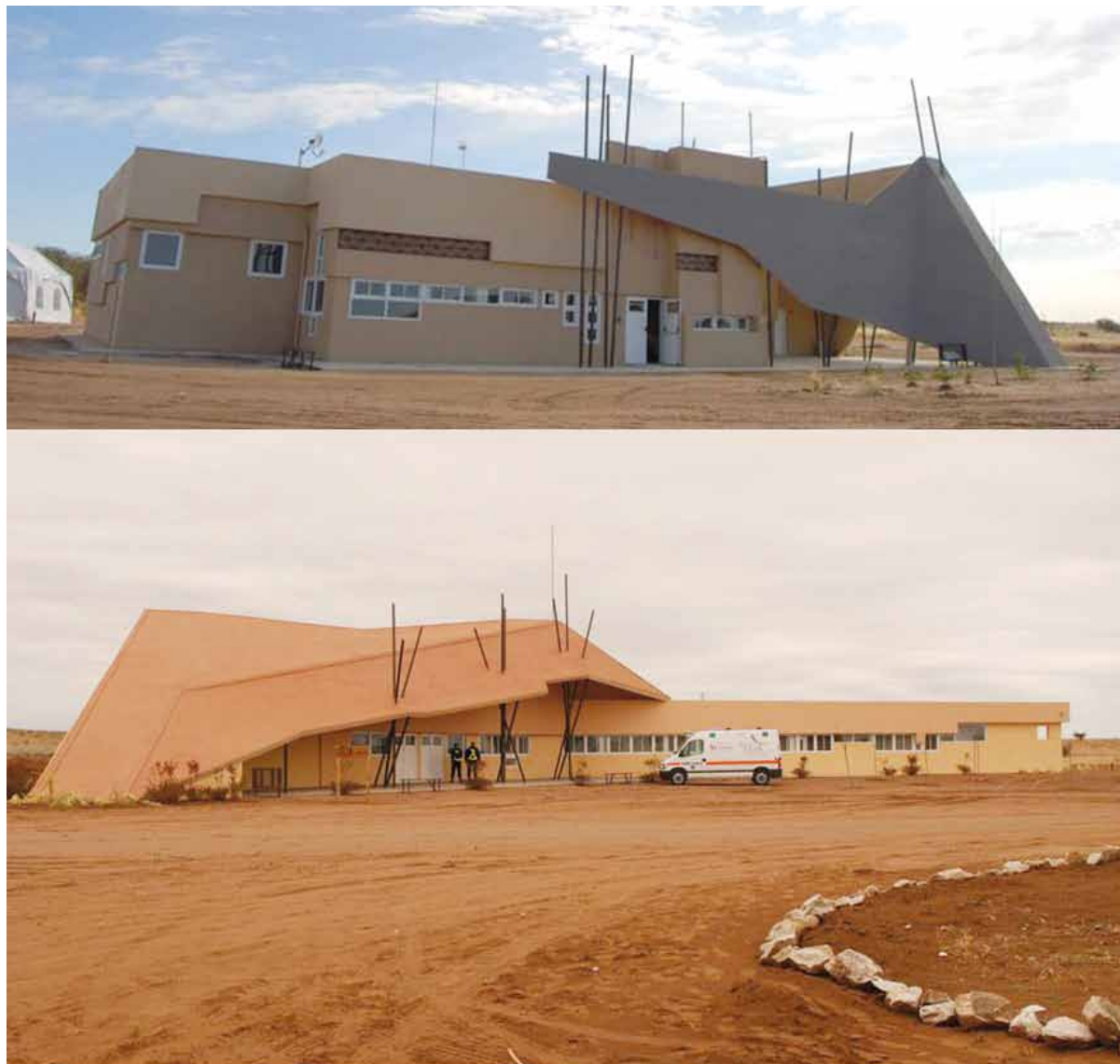
Figura 2. Arriba: Ruka Kimuy (escuela). Abajo: Ruka Tremoi (hospital).