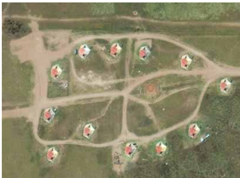
Figura 4. Vista aérea de uno de los aduares del pueblo y la disposición de las rukas .

Otra característica urbanística destacada, además de la casa tipo toldo, es la disposición circular de