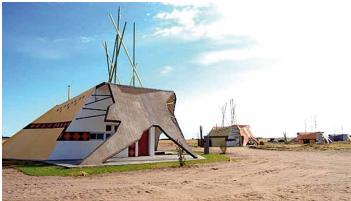
Figura 3. Las rukas vistas desde el frente.

Sin embargo, en la escuela y en el hospital rankül , algunos elementos y prácticas denotan la intervención y presencia de sentidos identitarios de sus pobladores. Así, por ejemplo, la Ruka kimuy (escuela o casa del saber) está decorada con textos y canciones en idioma rankülche y con obras artesanales que comunican una reflexión o mensaje sobre la cultura indígena. Un ejemplo de ello es la piedra tallada que reproduce el escrito del Popol Vuh o Libro del Consejo de los indios Quichés que dice: "Arrancaron nuestros frutos, cortaron nuestras ramas, quemaron nuestro tronco, pero no pudieron matar nuestras raíces. Popol Vuh. Pueblo Rankül". Otra situación se observa en una tela con manos pintadas que se encuentra colgada sobre un atril y que tiene como texto "El Patrimonio cultural es la memoria viva de nuestra historia". En dicha frase, se otorga valor patrimonial al hecho de conservar los saberes sobre la historia y la raíz de estos pueblos. A ello se suman los testimonios de pobladores que reconocen a la escuela como un espacio donde se pueden "recuperar lecturas, redactar relatos sobre nuestra identidad [...], reconocer las distintas versiones de la historia de los pueblos originarios para poder hacer validar la nuestra" (Poblador 4, entrevista 2015), y donde se celebran fechas propias, como el 11 de octubre, considerado el "Último día de libertad de los