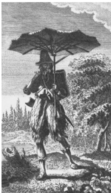
Ilustração de La vie et les aventures surprenantes de Robinson Crusoé , 1768, chez Laurent Prault, Paris.

Decidiu-se por fim a proceder ao lançamento que obscuros pressentimentos o faziam há tanto tempo adiar. Não o surpreendeu muito a impossibilidade de arrastar pela areia até ao mar aquele casco de peso talvez superior a mil libras. Este primeiro fracasso revelou-lhe, todavia, a gravidade de um problema em que nunca tinha seriamente pensado. Serviu-lhe a ocasião para descobrir um aspecto importante da metamorfose que seu espírito sofria sob a influência da vida solitária. O campo da sua atenção parecia aprofundar-se e, ao mesmo tempo, estreitar-se. Tornava-se-lhe cada vez mais difícil pensar em várias coisas ao mesmo tempo, ou até passar para outro tema de preocupação. Descobriu assim que outrem é para nós um poderoso fator de distração , não apenas porque nos perturba constantemente e nos arranca ao pensamento atual, mas ainda porque a simples possibilidade do seu aparecimento lança um vago luar sobre um universo de objetos situados à margem da nossa atenção mas capaz a todo o momento de se lhe tornar o centro. Esta presença marginal e como que fantasmal das coisas com que, de imediato, não se preocupava apagava-se aos poucos no espírito de Robinson. Encontrava-se doravante rodeado de objetos submetidos à lei sumária do tudo ou nada, e fora assim que, absorvido na construção do Evasão , perdera de vista o problema de como o lançar à água. (Tournier, 1985, p.31-2)