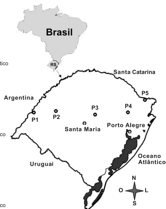
Figura 1. Características ambientais dos pontos amostrais. Dados climáticos extraídos de Buriol et al. (1979) e IPAGRO (1989); dados de vegetação natural extraídos de IBGE (1986) e classificação conforme Embrapa (2006).