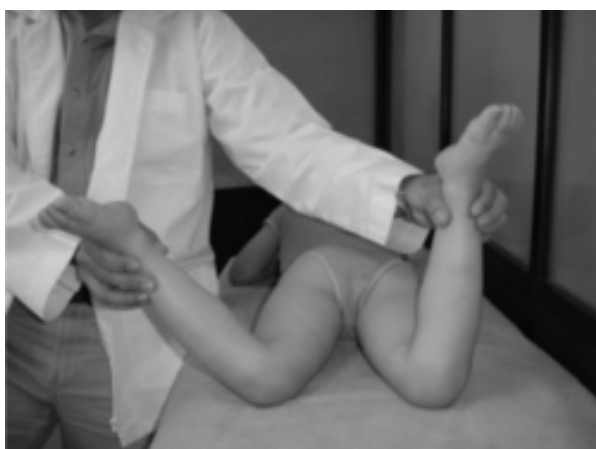
Figura N° 3 ROTACIÓN INTERNA EN DECÚBITO PRONO. OBSÉRVESE LA LIMITACIÓN EN LA ROTACIÓN DE LA CADERA DERECHA AFECTADA

La maniobra de rotación de la cadera con el miembro inferior en extensión, como se ilustra en la figura N° 4, puede ayudar a determinar la intensidad de la inflamación articular y diferenciar entre sinovitis transitoria y artritis séptica, porque es más probable el diagnóstico de la primera si se logra una rotación de la cadera mayor de 30°.