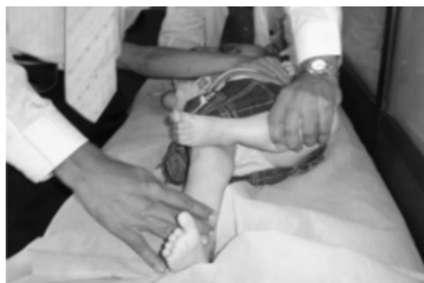
Figura N° 5 MANIOBRA DE PATRICK

Si flexionando la cadera en un adolescente, se observa rotación externa, se debe sospechar deslizamiento epifisiario; esta puede ser una manifestación temprana cuando los hallazgos radiográficos todavía son mínimos (figura N° 6).