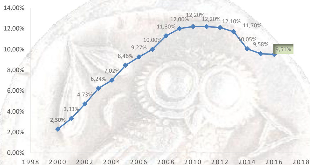
Gráfico 1. Evolución de la tasa de inmigración en España (2000-2016)

Fuente: Instituto Nacional de Estadística (INE)