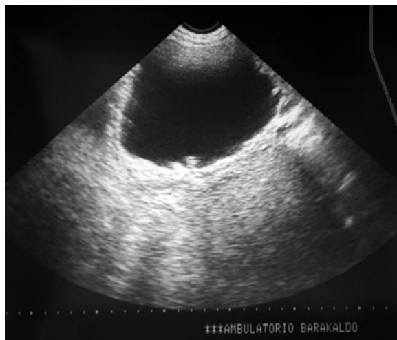
FIGURA 1. Imagen ecográfica: dudoso proceso neofornativo en vejiga.

En el momento de la presentación, la mayoría de los tumores están confinados a la próstata (1,3) con unos niveles séricos del PSA a menudo normales, salvo en pacientes con estadios avanzados (4). Esta discrepancia en los niveles séricos del antígeno prostático específico podría explicarse por el comienzo temprano de la sintomatología obstructiva, lo que lleva al paciente a consultar y ser intervenido por su clínica miccional, consiguiendo por tanto un rápido diagnóstico del car-